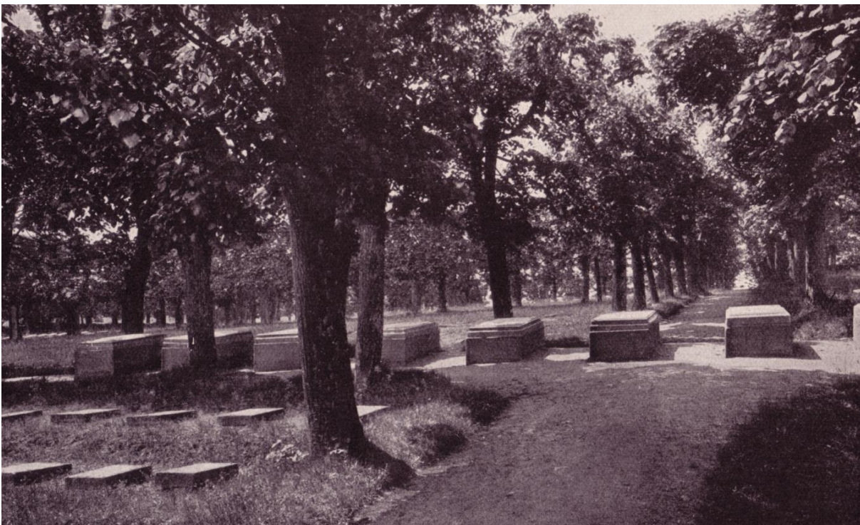
Abb. 1: Gottesacker Herrnhut, Ansicht der Zinzendorfgräber von Osten, Foto um 1925. Im Vordergrund links sind die Grabstätten der einfachen Gemeinemitglieder mit flach liegenden Steinen zu erkennen. Die Gräber der Familie Zinzendorf (Bildmitte) liegen herausgehoben auf der Hauptachse des Gottesackers. Gut erkennbar sind die geschnittenen alten Lindenalleen.

Tabellen fassen viele gleichartige Informationen (z.B. Gehölzarten und -maße) übersichtlich zusammen. Abbildungen und Pläne sollen dem Leser helfen, das im Text Gesagte nachzuvollziehen und weitschweifige Beschreibung im Text zu ersparen. Sie vermitteln dem Leser durch aussagekräftige Bildunterschriften schnell viele relevante Informationen: