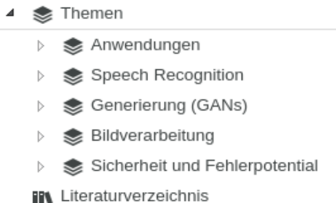
Abbildung 1: Unterthemen