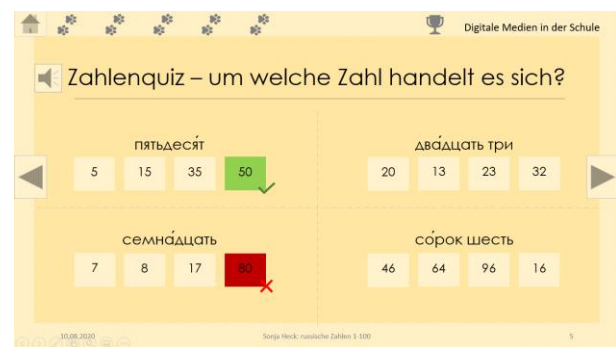
Zweiter Übungstyp. Gewählte Antworten färben sich grün bei richtiger und rot bei falscher Antwort.