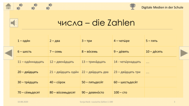
Übersicht über die Zahlwörter 1 – 100