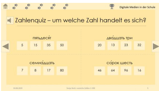
Zweiter Übungstyp. Eine Lösung wird durch einen Klick auf die Zahl ausgewählt.