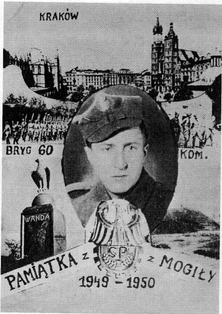
Abbildung 1: Ein Erinnerungsfoto von der Baustelle Nowa Huta eines Mitgliedes der 60. Brigade der Militärischen Ausbildung des „Dienstes für Polen“.