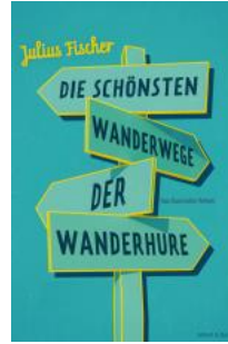
Voland & Quist, 2013

Darf der satirische Kurzgeschichtenband des Kabarettisten und Slam-Poeten Julius Fischer unter diesem Titel vertrieben werden?