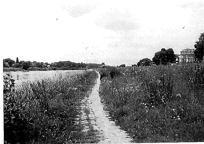
Leinpfade mit Sandsteinbelag sind oft noch gut erhalten und werden heute als Radwege genutzt