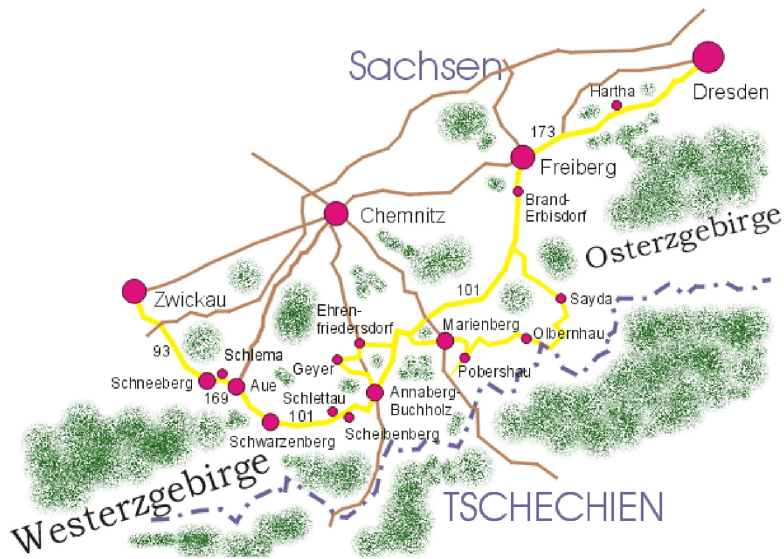
(Karte: Hans-Joachim Fröde 2004)