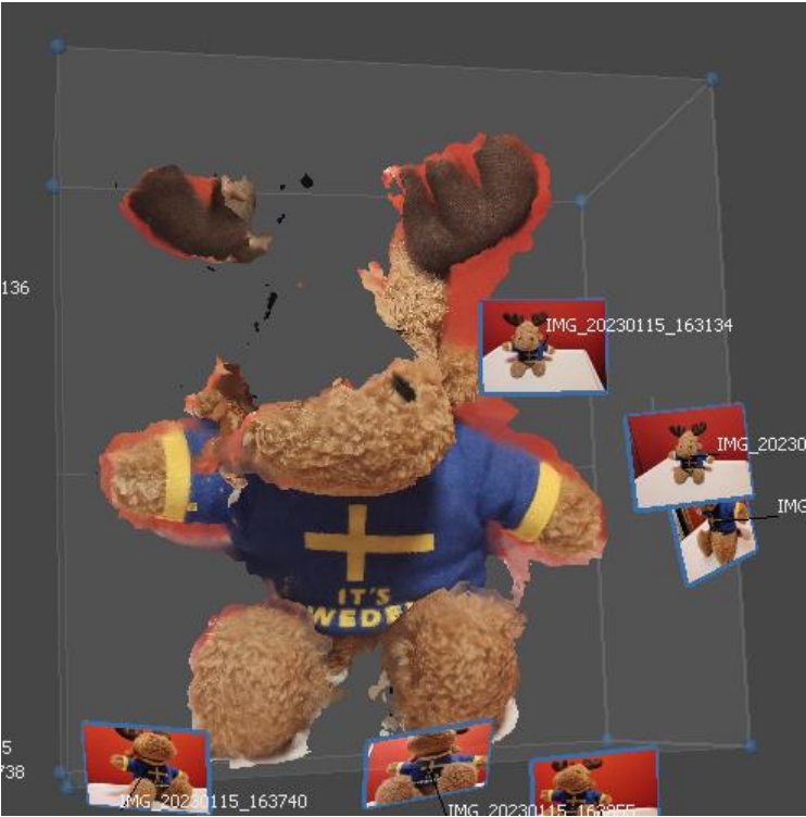
Abbildung 4: Build Textures – 1