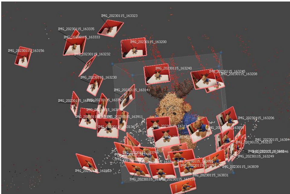
Abbildung 1: SfM - Fotos ausrichten 1