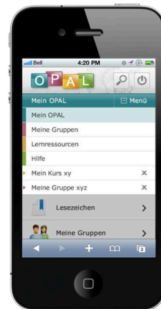
Smartphone mit alter mobiler Ansicht OPAL